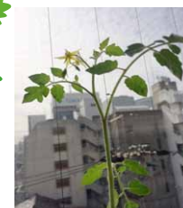
これがプチトマトの花…

そうか!社内に足りないのはベツトだったのか!よしよしや!と、コンビニサラダのケースを利用して、近所の公園から土を失敬、この正体不明な双葉ちゃんを『飼い』始めました。「ゴマかな?」「オクラかな?」、謎な双葉に毎日お水を遣り続け。双葉はすくすく育ち。昨年のお盆休みには水をやる人がおらず、一度枯れましたが、しつこく水をやり続けたら見事復活(涙)!今年のお盆はベトナム女子'sに水やりをお願い、どうと花が咲きました!あー感無量!匂いを嗅ぐと、「あ、トマト!」…。葉の形状、花の形状ではわからなかった都会っ子二人。今では立派なプチトマトが真っ赤に実っています。木上で熟したそれは、今まで食べたどのトマトより甘いものでした。