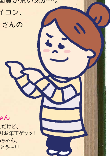
咲ちゃん 社会人だけど、 こっそりお年玉ゲッツ! おばあちゃん、 ありがとう~!!