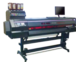
特色／白・クリア印刷